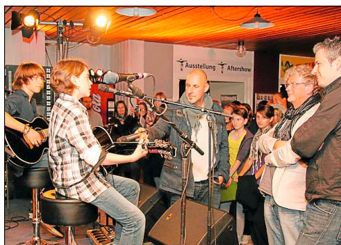
Nur keine Hemmungen: Nachwuchsmusiker zeigen nach dem Workshop ihr Können.

Kalter, roter Tee? Nee. Keine Mittagsruhe, kein Stress mit dem Herbergsvater. Und keine peinliche Klassendisco am Abend. Heute wird gerockt in der Jugendherberge. Und wie. Der Speisesaal verwandelt sich zum Backstage-Bereich, das Foyer zum Bühnenraum. Mittendrin: ihr, die ihr Lust habt an richtig guter Musik.